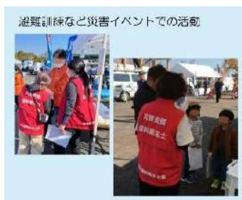
東日本大震災避難所 (体育館)

災害避難所では、災害関連死の3割を占めるという肺炎防止のために、お口の中から命を守る、高齢者の誤嚥性肺炎を防ぐケアを行います。毎年行われる県や市の災害訓練にも参加し、東日本大震災、熊本地震の際には、歯科医師と共にチームとして派遣されて活動いたしました。